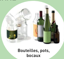
Bouteilles, pots, bocaux

SANS BOUCHONS BIEN VIDER INUTILE DE LAVER