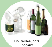
Bouteilles, pots, bocaux

SANS BOUCHONS BIEN VIDER INUTILE DE LAVER