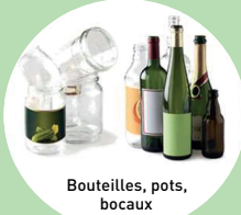
Bouteilles, pots, bocaux

SANS BOUCHONS BIEN VIDER INUTILE DE LAVIER